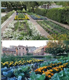
Huertas de San Millán. Especies plantadas desde 2014 hasta...