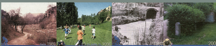
Recortes de prensa: Segovia Ayer y Hoy. (Dos imágenes izquierda: Valle del Clamores; Dos imágenes derecha: El Arroyo Clamores)

En la década de los años 20 del siglo pasado se soterra el río de la rotunda del pastor a Sancti Spiritu, y en los 70, el resto.