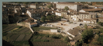
1988. San Millán. Huerta del Moro. Adquirida en una subasta en internet.

Primera mitad del s. XII, los nobles comienzan a habitar el recinto amurallado y en la vertiente que da al industrial valle del Clamores, se asienta la judería y la población cristiana dedicada a las pequeñas artesanías y al tráfico mercantil.